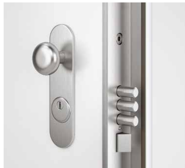
Bezpečnostní dveře ve standardu NEXT, Bílé, třída bezpečnosti 3, bezpečnostní zámek, protipožní, kování klika/koule, výška 2350mm, kukátko. Kovové prvky stříbrné barvy.