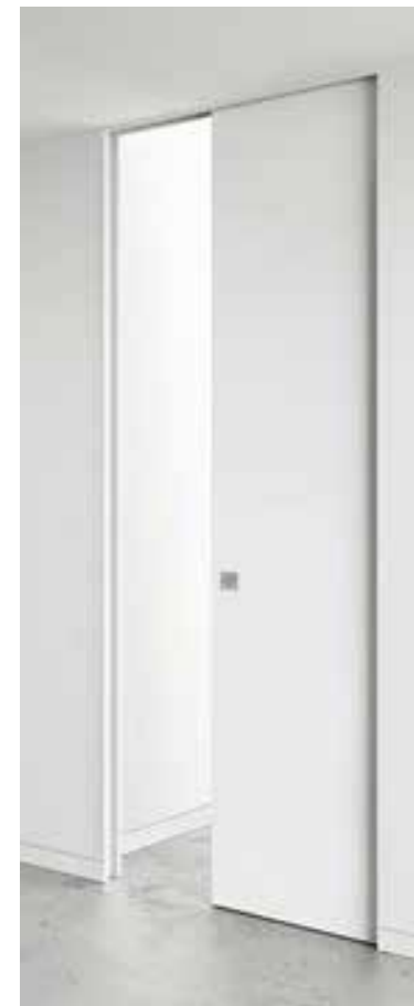
Posuvné dveře bez obložky, výška do stropu v=2400mm. Barva kování ve stříbrné barvě.