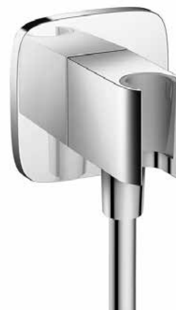
Vanová sprcha Croma select S.