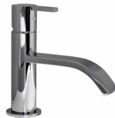
Stojánková baterie Antonio Lupi Bikappa pro umyvadla.