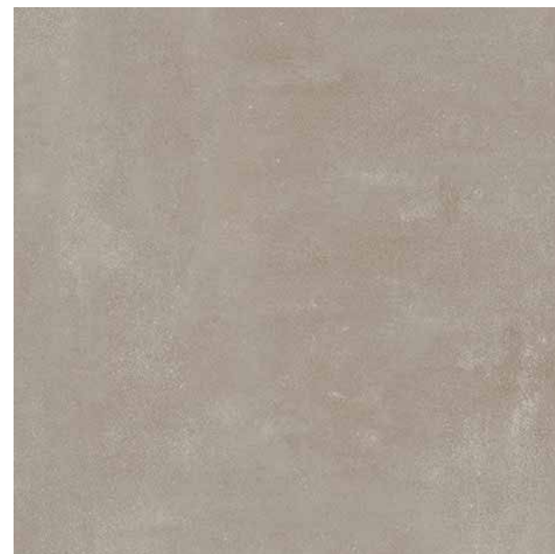
Dlažba na podlaze v koupelnách a WC s minimálními sparami: ve standardu Atlasconcorde Boost Pearl 60x60 Matt