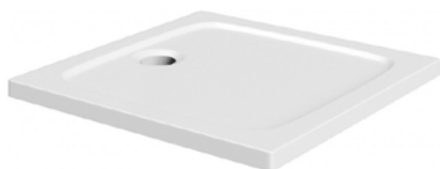
Easy sprchová vaničky, 80x80x3 litý materiál, bílá. RainDrain 90 XXL odtoková souprava ke sprchové vaničce, pohledové díly chrom.

NADSTANDARD Sprchový kout bez vaničky, povrch dlaž- ba v minimálním spádu. Vtok řešen kanálkem.