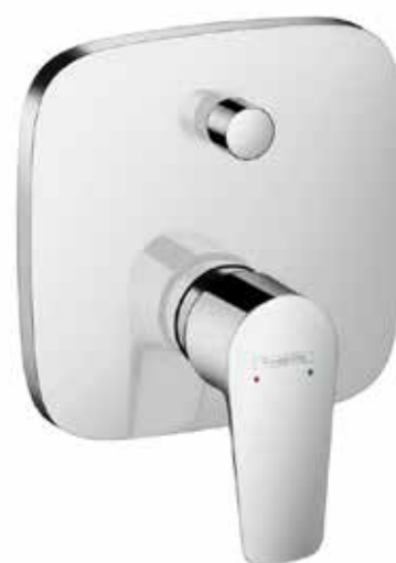
Podomítková vanová baterie Hansgrohe Talis E.