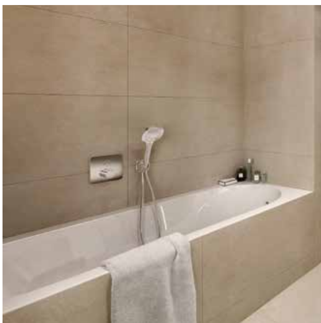
Vana Villeroy&Boch Oberon, 180x80, Quaryl, bílá.