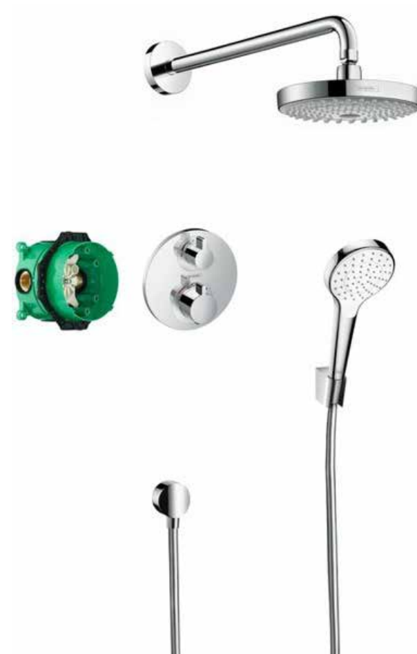
Sprchová baterie Hansgrohe Croma. Select S 1jet ruční sprcha bílá/chrom, EcoSmart 7l/min.

NADSTANDARD Zástěna pro sprchový kout bez vaničky.