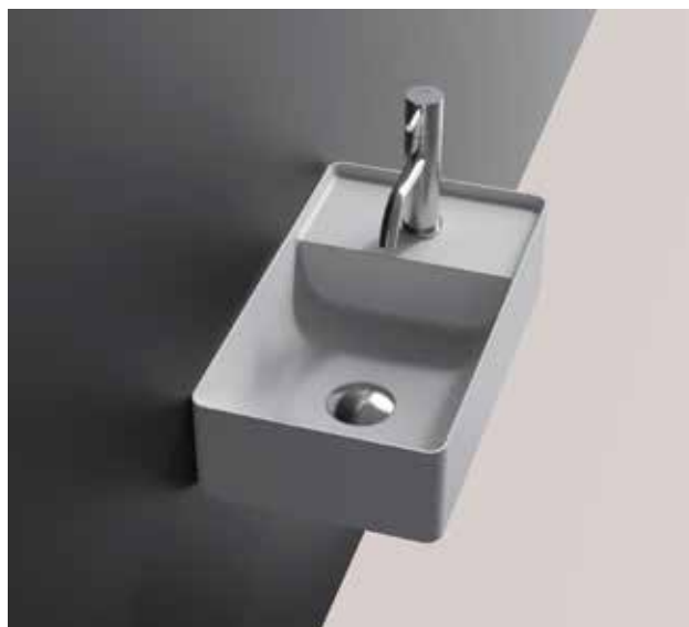
Umývatko Antonio Lupi Simplomani. Osazeno na desce bez viditelných kotevních prvků.