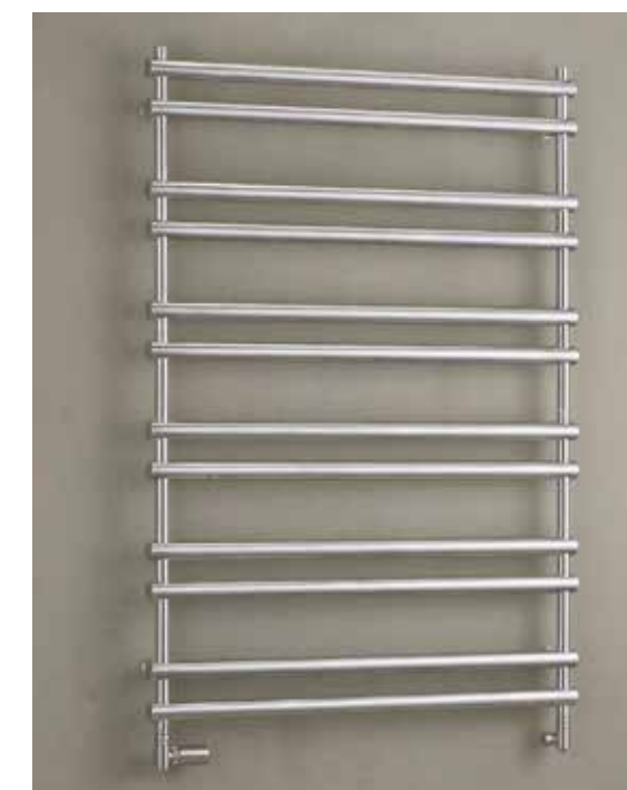
Topný žebřík ve standardu P.M.H. Ulysses.