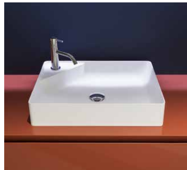
Umyvadla Antonio Lupi Simplo. Osazeno na desce bez viditelných kotevních prvků.