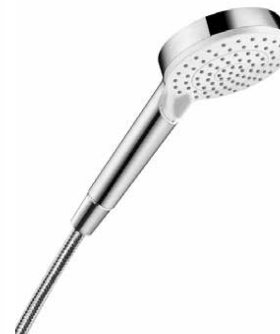
Vanová sprcha Croma select S.