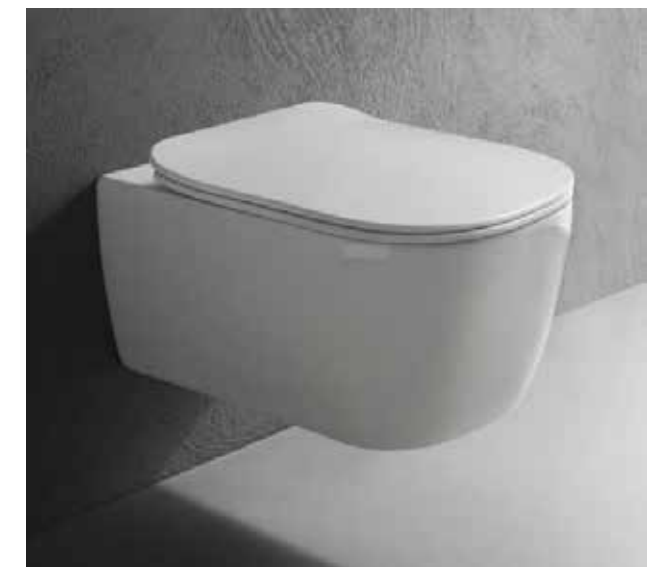
Záchod Antonio Lupi Komodo, bílé. Tlačítko 2-činné TeceNow, lesklý chrom. Sedátko slim, duroplast, soft-close. Bidety jsou ze stejné řady.