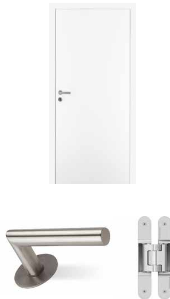
Vnitřní bílé dveře bez polodrážky, obložková zárubeň slícovaná se stěnou, výška 2350mm. Bíle lakované. Rozetové kování se zapuštěnou rozetou, magnetická střelka. Dveřní závěs Tectus 3D, skrytý, stříbrná barva. Standard obložková zárubeň Latente, dveřní křídlo hladké.