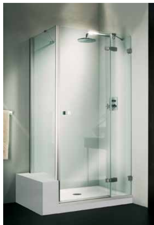
Gallery 3000 sprchové dveře s pevným segmentem, výška 2050mm, sklo s úpravou Protect, profily a panty chrom/alu, upevnění DX.

NADSTANDARD Sprchový kout bez vaničky, povrch dlaž- ba v minimálním spádu. Vtok řešen kanálkem.