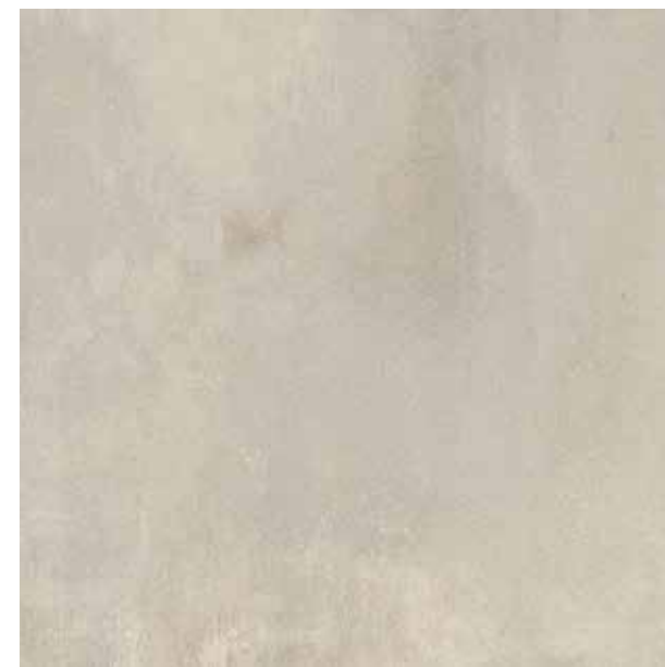
Obklad stěn v koupelnách a WC s kamenickými detaily a s minimálními sparami: ve standardu Atlasconcorde Boost white 45x90 Matt