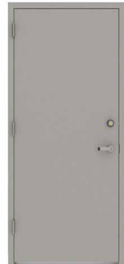
Plechové sklepní dveře se zvýšenou bezpečností, na polodrážku, bezpečnostní kování, rozpěrná závora.