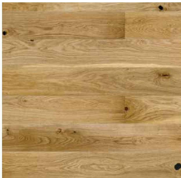
Podlaha v pokojích a předsíních: Dřevěná dvouvrstvá dubová lamela je vhodná pro podlahového vytápění. Součástí podlahy jsou též zapuštěné sokly pro snadnou údržbu podlahy.